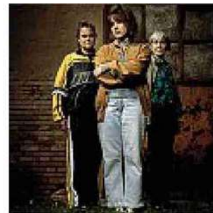
In scena «Misurare il salto delle rane»