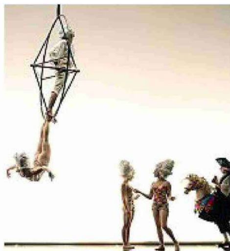
Lo spettacolo «Titizé - A venetian dream»