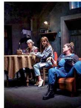
Le tre attrici impegnate nel testo di Gabriele Di Luca

segni di una infastidita ironia, di un'aggressiva violenza, di una solitudine opaca, «esplora le contraddizioni dell'esistenza, la pesantezza e la leggerezza, il dolore e il riso, il radicamento e il desiderio di evasione», senza mai rinunciare al gioco delle situazioni paradossali costruite dagli attori per i loro personaggi, alternando momenti di intensità visiva a passaggi di caustica comicità.