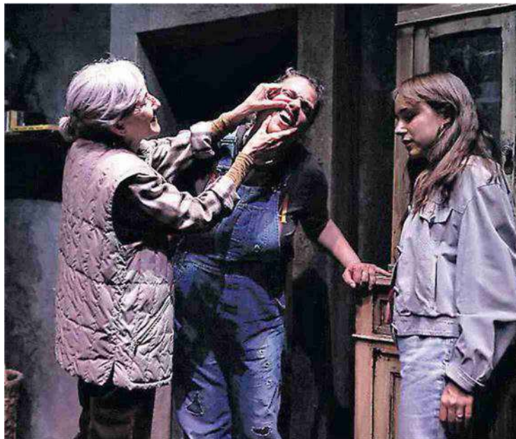
MICROCOSMO FEMMINILE Le tre protagoniste sul palco del teatro Nuovo

GRAN BELLO SPETTACOLO AL NUOVO PER IL «CAMPANIA TEATRO FESTIVAL»: MERITO DEL TESTO DI DI LUCA E DELLE TRE INTERPRETI