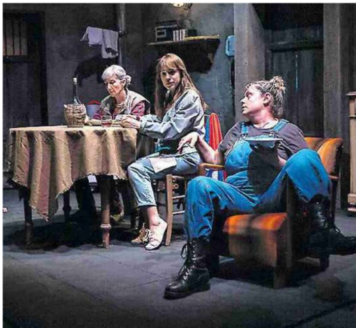
LA PRIMA Una scena di «Misurare il salto delle rane» della Carrozzeria Orfeo

CARROZZERIA ORFEO ESPLORA IL TEMA DELLA VIOLENZA SULLE DONNE PER IL «CAMPANIA TEATRO FESTIVAL»