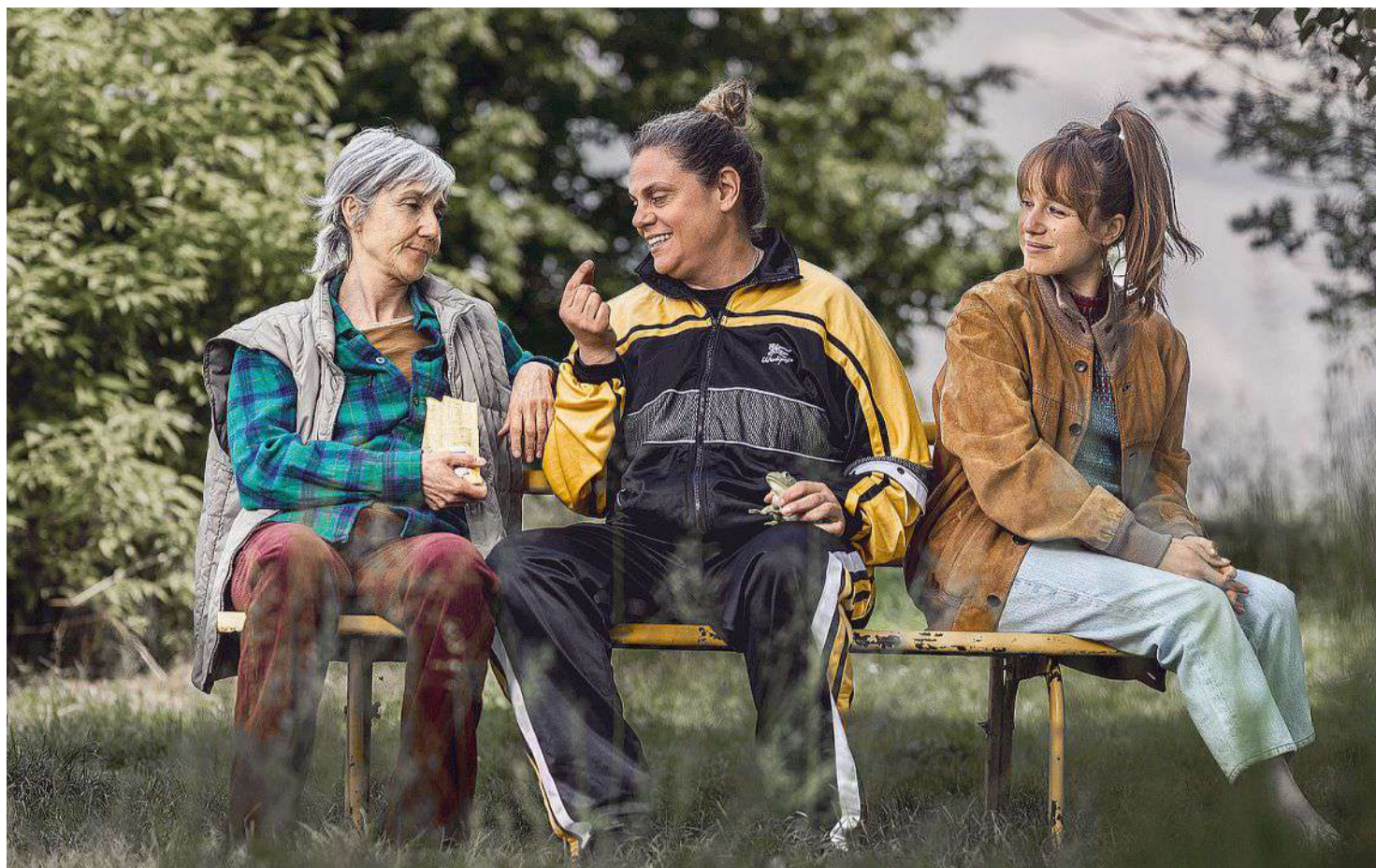
Una scena di "Misurare il salto delle rane" in prima nazionale al Teatro Nuovo di Napoli

Al Campania Teatro Festival il nuovo spettacolo di prosa di Carrozzieria Orfeo che dopo l'IA, Trump e le guerre esplora le intime pieghe emotive di vite inespresse